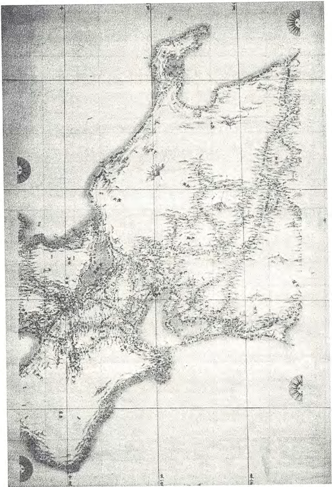
图 1-1 成田山仏教図書館蔵 文政4年伊能中图(中部)